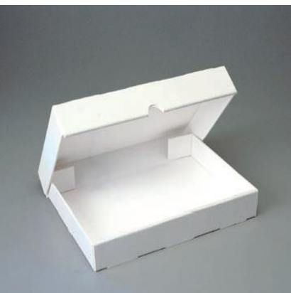
SB 31: Klappdeckelbox