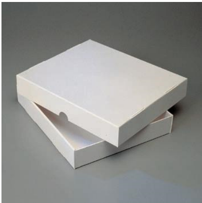
SB 21: Stülpdeckelbox