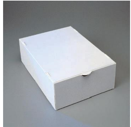
SB 41: Archivbox mit Frontklappe