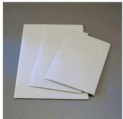
SB 91: Jurismappen